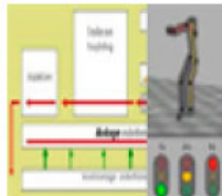
Herramienta D: diseño y evaluación de los procesos de trabajo

Mejora de la Seguridad y Salud Ocupacional en las Pymes Europeas con la ayuda de la Simulación y la Realidad Virtual