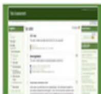
Herramienta A: el conocimiento y el aprendizaje del sistema de gestión

En el proyecto, apoyado y cofinanciado por el séptimo programa marco para la investigación y desarrollo tecnológico de la Unión Europea (FP7), SPMAZ ha participado como asesor científico del mismo.