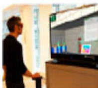
Herramienta C: formación de inmersión para el trabajo en estaciones de trabajo y con las máquinas