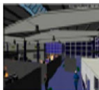
Herramienta B: formación para la seguridad en caso de emergencia